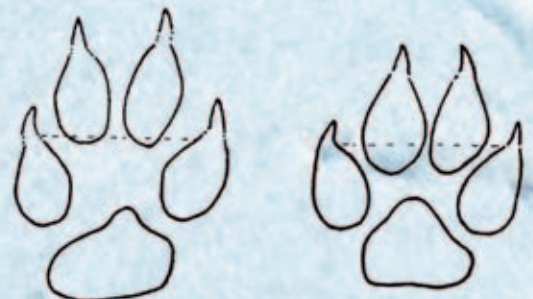
Zeichnung: Erwin Meier

Ihre Trittsiegel sehen sich zum Verwechseln ähnlich: Dasjenige des Fuchses (links) ist langgestreckter, und die beiden Seitenzehen erreichen die Ballen der Mittelzehen nur im hintersten Teil.