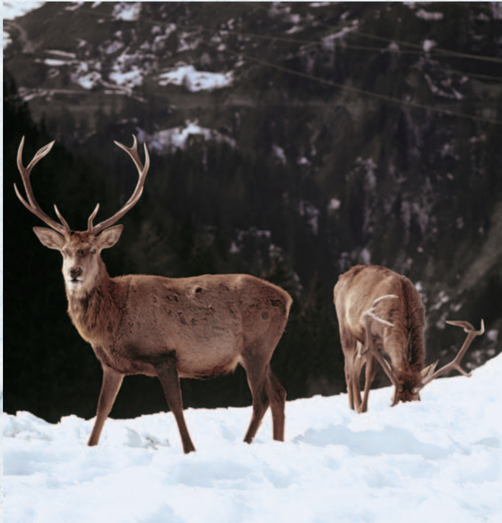
Hirsche im Schnee: Ihre Spur unterscheidet sich deutlich von Rehspuren

Auch die Marder bewegen sich hüpfend fort, setzen jedoch die Tritte der Hinter- in die der Vorderläufe, wodurch in der Spurabfolge nur zwei paarweise nebeneinander stehende Trittsiegel erscheinen, weshalb man dies als Paarsprung bezeichnet. Eine weitere Besonderheit ist das Nageln, typisch beim Dachs, wenn sich vor allem die kräftigen Grabekrallen an den Vorderpranken vor