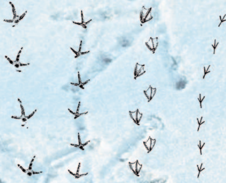
Auerhahn Fasan Stockente Krähe

Die Geläufe von Auerhahn, Fasan, Stockente und Krähe.