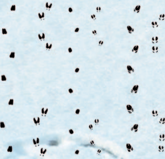
Rothirsch Reh Wildschwein

Ziehende und flüchtende Fährte von Rothirsch, Reh und Wildschwein. In der Flucht spreizen sich die Schalen, was das Einsinken im Schnee mindert, und dahinter zeichnen sich die Afterklauen ab.