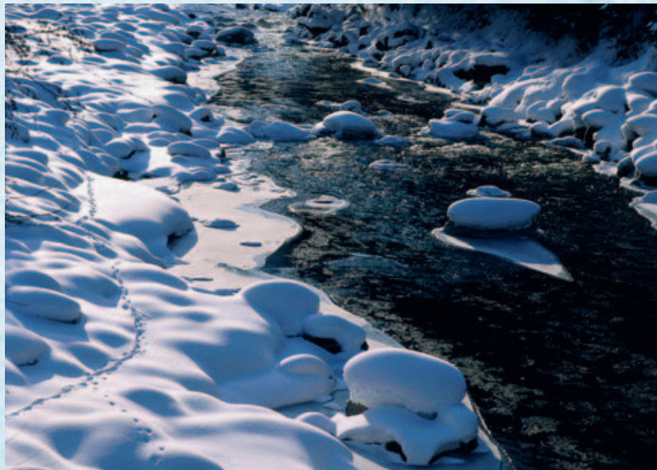
Tierfährten: Wer Tierspuren lesen kann, bekommt Geschichten erzählt

Solche Rücksichtnahme, die das eigene Vergnügen kaum mindert, hilft dem Wild, unnützen Kräfteverschleiss beim provozierten Flüchten zu vermeiden – und vielleicht gerade deshalb die ohnehin harte Winterzeit zu überleben. ■